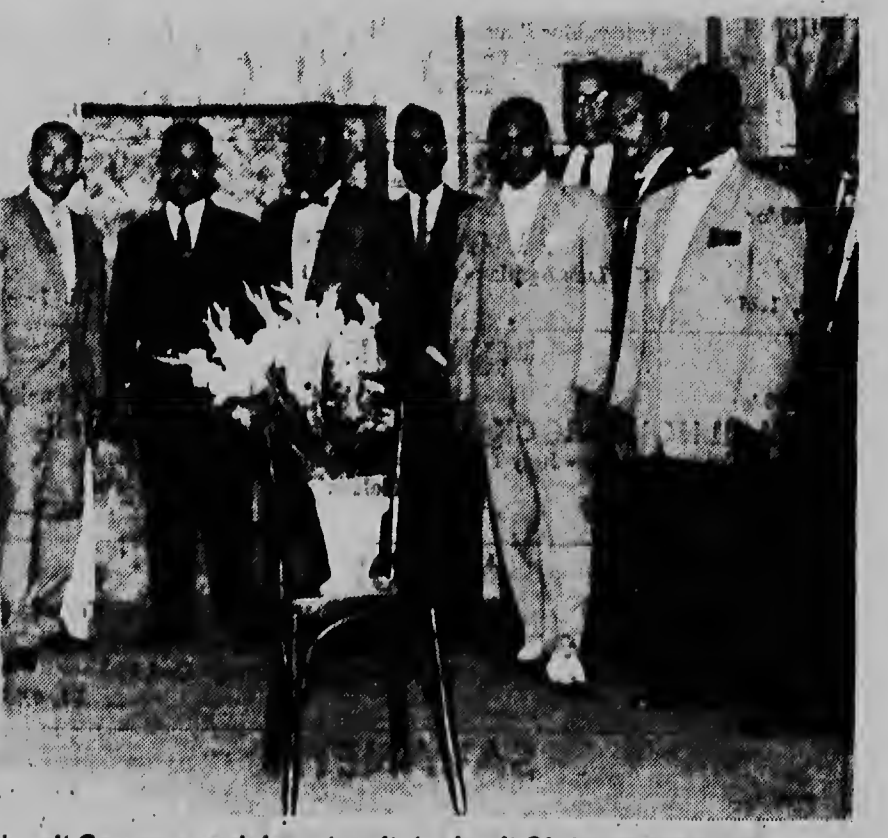
Aki ta e grupo di directiva di Corsow y e delegacion di Aruba di Clubnan Bonairiano.